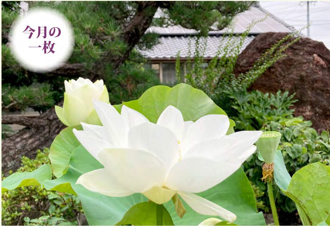
順慶寺の白蓮華（順慶寺境内にて）